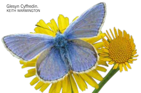
Glesyn Cyffredin. KEITH WARMINGTON

Mae torri-a-chasglu gwair yn ffordd seml o leihau ffrwythlondeb y pridd ar laswelltiroedd amwynder. Yn ystod y tymor tyfu, mae planhigion yn troi'r maetholion sydd yn y pridd yn ddail, blodau a hadau. Os tynnir y deunydd byw o'r glaswellt, rhwystrir y maetholion hyn rhag dychwelyd i'r pridd. Gellir torri-a-chasglu hyd at bedair gwaith y flwyddyn yn y