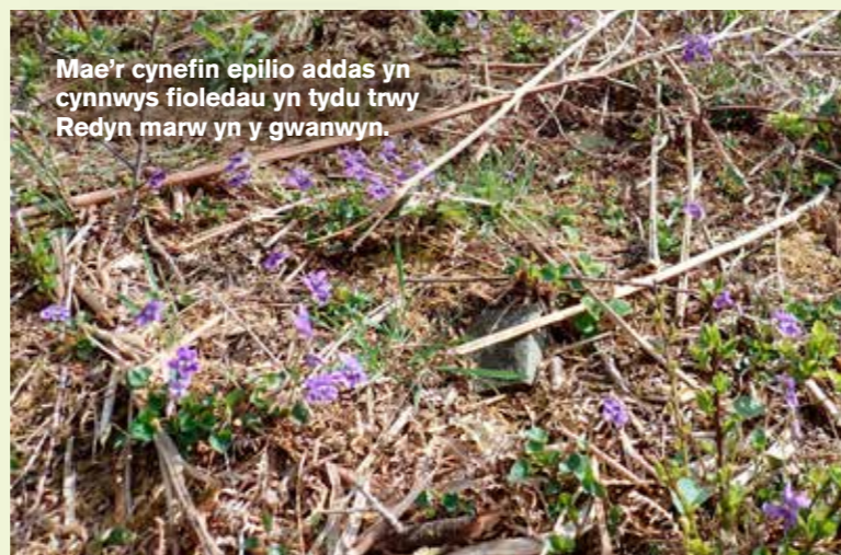
Mae'r cynefin epilio addas yn cynnwys fioledau yn tydu trwy Redyn marw yn y gwanwyn.