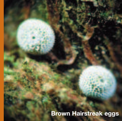
Brown Hairstreak eggs

Canolir y cytrefi fel rheol o gwmpas coedwig, ond mae'r wyau'n arfer cael eu dodwy ar draws sawl milltir sgwâr yn y wlad o gwmpas. Mae angen cyfuniad o goetiroedd, prysgwyd a pherthi sy'n cynnwys digonedd o ddrain duon wedi'u rheoli'n briodol. Mae'r rhan fwyaf o gytrefi i'w cael ar briddoedd trymion neu gleiog, lle y mae drain duon ymhlith prif elfennau'r perthi neu'r prysgwydd.