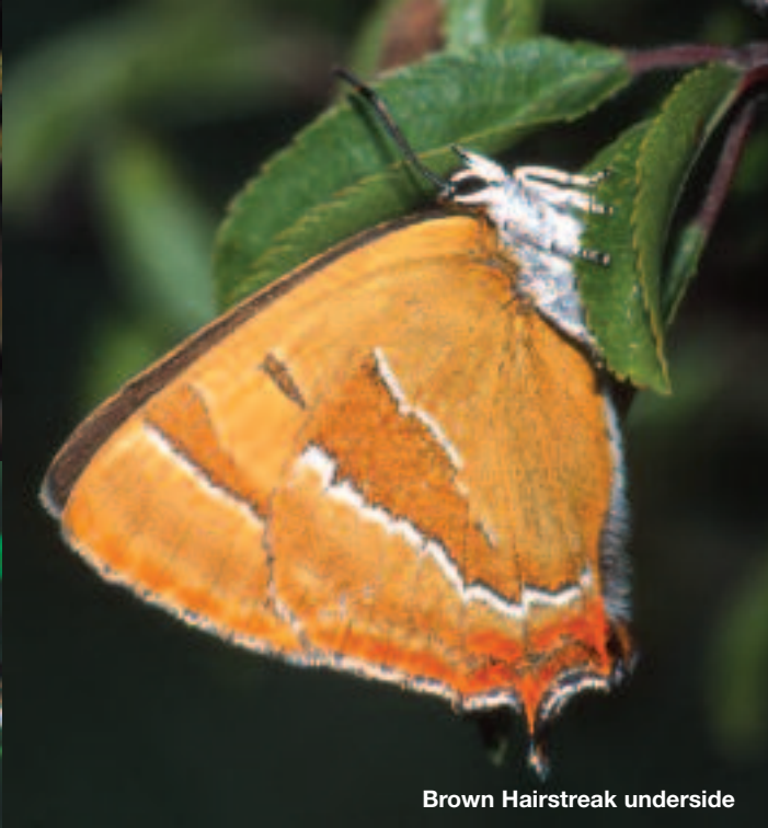
Brown Hairstreak underside